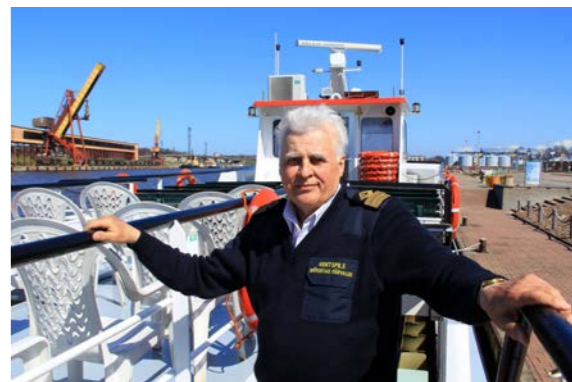
Капитан судна «Hercogs Jekabs»