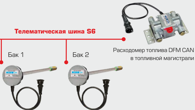
Датчики уровня топлива DUT-E CAN в баках